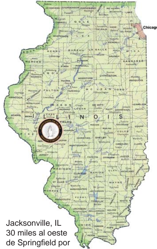
Jacksonville, IL 30 miles al oeste de Springfield por I-72